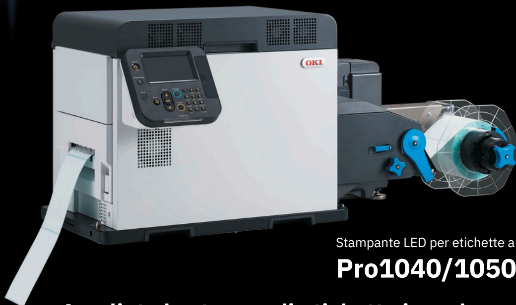
Stampante LED per etichette a colori

La Serie Pro1040/Pro1050 è costituita da stampanti LED per etichette a colori che utilizza il toner. Questa Serie consente di trasformare le possibilità di stampa a colori in sede in qualcosa di straordinario. Stampa immediata on demand con breve preavviso. Si tratta di una nuova generazione di dispositivi di stampa ideale per le basse tirature e, con un ciclo di lavoro fino a 160.000 pagine al mese, più che sufficiente anche per tirature più elevate. Con la sua facilità d'uso e il costo totale di proprietà ridotto, questo conveniente dispositivo di stampa consente di produrre etichette stampate di alta qualità, offrire nuovi servizi e far crescere l'azienda e gli utili. Per questa stampante non sono necessari supporti dedicati poiché offre una grande scelta di supporti di stampa a un costo accessibile. Con Pro1050, l'aggiunta del toner bianco consente di eseguire ciò che la maggior parte dei dispositivi di stampa a bassa tiratura non è in grado di fare. Ampliate le vostre offerte di stampa producendo uno straordinario bianco o colori brillanti su supporti trasparenti e supporti scuri. Pro1050 offre la possibilità di creare un'ampia gamma di prodotti mozzafiato, tra cui etichette per alimenti, bevande, cosmetici e altre applicazioni.