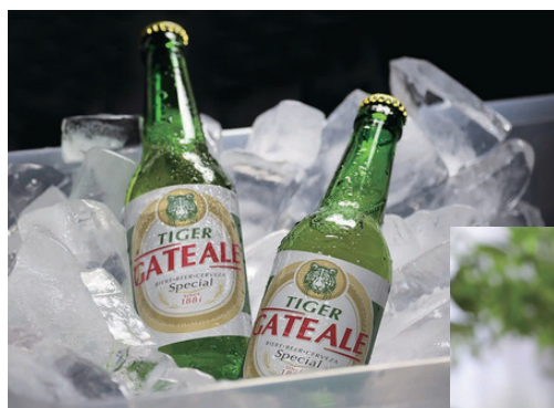
Creazione di etichette altamente personalizzate con colore bianco spot